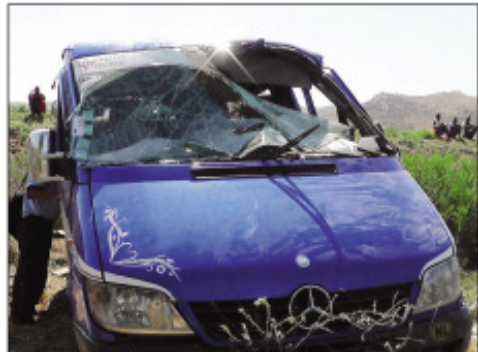
Ilay fiara mpitatitra voatititra nifatra tany an-tanimbary.