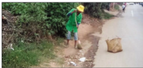
Ny asa fanadiavana teny amin'ny Boriboritany faha-2.