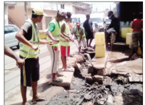
Ny fanadiovana tatatra sy lakan-drano tao amin'ny Boriboritany faha-5.

Notohizana teny amin'ny lalana Hagamainty Anja- nahary ny ezaka fanadiovana ireo tatatra rehetra ataon'ny Boriboritany faha-V, Kaominina Antana- narivo Renivohitra (CUA). Ireo ekipa teknika no niantoka ny fahatanterahan'izany ny 06 Novambra 2018 teo. Tanjona ny tsy hizany ny fahatsentsen- an'ireo tatatra intsony, izay mety hahatonga ny fiakaran'ny rano sy ny fiparitahan'ireo otrik'aretina maro, indrindra amin'izao fotoam-pahavaratra izao.