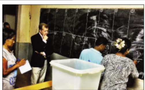
Ny mpiandraiki-draharaha Amerikana, nijery ny fizotry ny fifidianana teto amin-tsika, tany amin'ny faritra Sava.