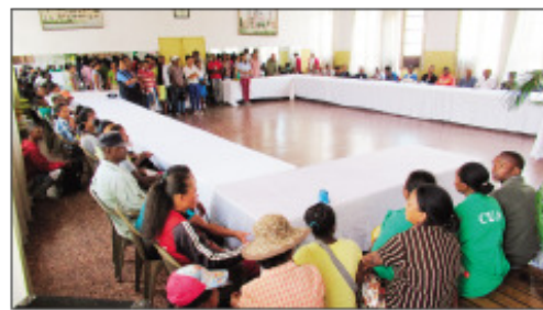
Ny lanonana niarahan'ny mpiasa tao amin'ny Boriboritany I.