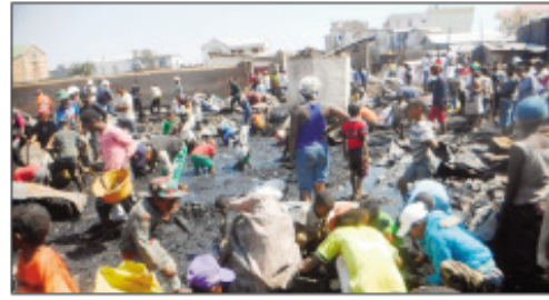
Ireo traboina may trano tetsy Anosibe Andrefana voalohany.

Nitrangana haintrano goavana tao amin'ny Fokontany Anosibe andrefana voalohany Boriboritany faha-4 ny alarobia teo, tokony ho teo amin'ny 11 alina teo. Raha ny tatitra azo dia afo avy ao amin'ireo trano hazo manodidina no niantomban'ny loza ka olona 4 no maty ary 1 kosa no may. Raha ny antontan'isa dia trano biriky miisa 8 sy trano hazo miisa 60 mihoatra no kila forehira tamin'izany, ka anisan'ireo ny fotodrafitra asa fantsakana na "Borne Fontaine" izay eo an-toerana ihany. Manoloana izany dia nandray andraikitra ny teo anivon'ny Boriboritany faha efatra Kaominina Antananarivo Renivohitra