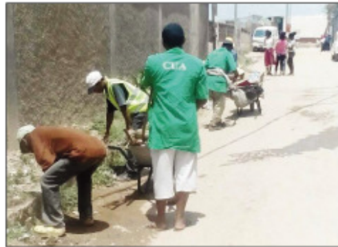
Ny fanadiovana faobe teny amin'ny Boriboritany faha-6.

riboritany anaovana fanadiovana faobe ankoatry ny asa fanadiovana andavanandro efa mahazatra, ka ny maraina izy ireo no manadio, ary ny tolakandro kosa mamerina manadio na manao « retouche ». Izao no natao dia mba hitazomana hatrany ny fahadiovana eto amin'ny tanànan'Antananarivo Renivohitra, ary hitsinjovana hatrany ny fahasalaman'ny daholobe.