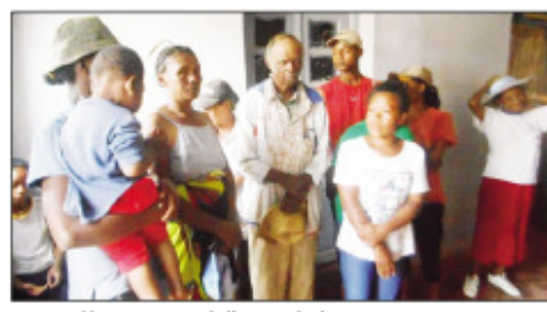
Ny sasany amin'ireo traboina may trano teny Antohomadinika atsimo.