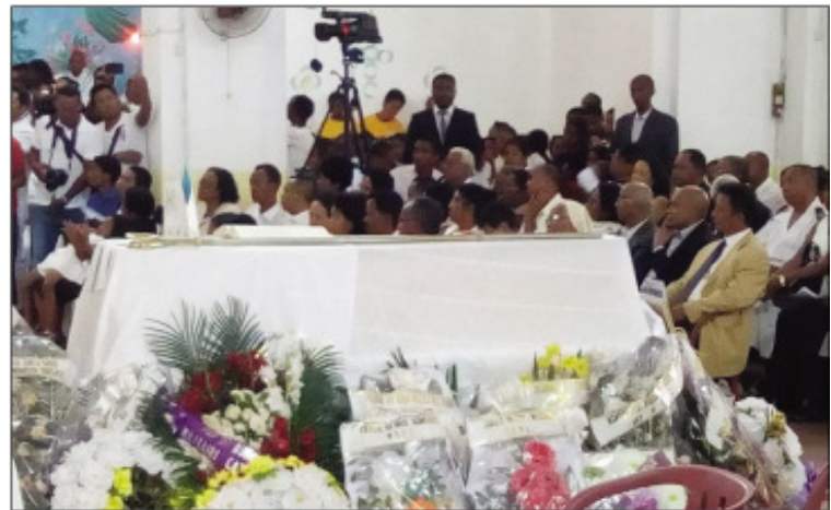
Fiaraha-misakafo ny mpiara-miasa tao amin'ny Boriborintany I.