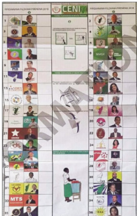
Santoniana biletà tokana tsy tena izy, nanaovana fanohanana manerana ny Nosy.