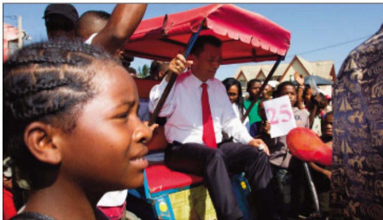
Ny fitsidihan'ny kandida N°25, Marc Ravalomanana, tany Toliara.