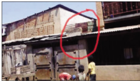
Teo amin'io tafo io no niditra ilay mpangalatra.

Vola 6 Tapitrisa ariany no lasan'ilay jio-lahy, naratra mafy kosa ilay tovovavikely. Ny talata hariva tokony ho tamin'ny enina ora hariva no nisy namaky ny Tranombarotra "Soanatao" izay masoivohon'ny Canal +, sy kiôska Mvola koa, ao Tsiroanomandidy renivohitry ny faritra Bongolava. Rehefa nirava avokoa ny mpiasa ary nivoaka ny olon-dehibe tao an-trano no nanararaotra namaky izany ny olon-dratsy, avy eny amin'ny tafo ao aorian'ny trano no nahafahan'ity olon-dratsy niditra ny fi-