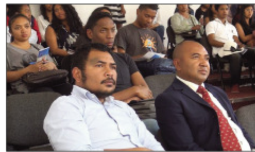
Ireo anisan'ny nanazava ny fianarana sy ny vatsim-pianarana any Angletera.

Miara-miasa feno amin'ny ambasadaoron'i Grande Bretagne ny kaominina Antananarivo Renivohitra (CUA), eo amin'ny sehatry ny fampianarana. Nampahafantarana fa misokatra izao ny vatsim-pianarana ho an'ireo tanora sy ireo izay maniry ny hianatra any Angletera, nisy ny fampahafantarana izany afak'omaly tetsy amin'ny lapa'ny tanàna Analakely, narahina famelabellaran-kevitra sy fanontaniana nanomezam-baliny ireo tanora liana amin'izany fianarana any Grande Bretagne izany, sady mety hahazoana ny vatsim-pianarana Chevening Scholarship.