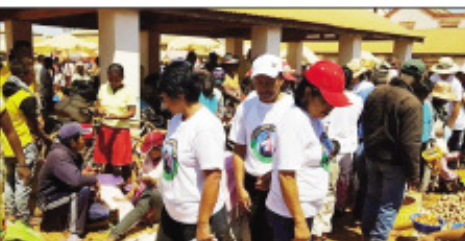
Ny nampahafantarana ny kandida N°25 Marc Ravalomanana tany Ambatofahavalo Atsimondrano.