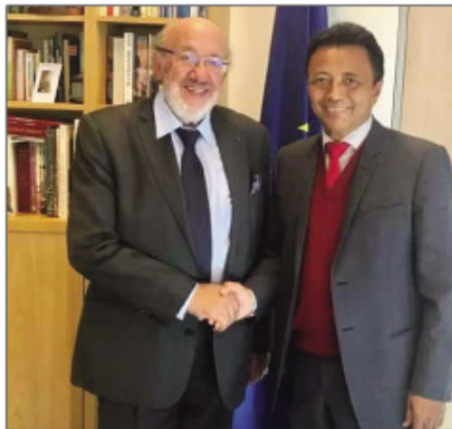
Ny fihanonana teo amin'ny Filoha Marc Ravalomanana sy ny kaomisera Eoropeana Louis Michel.