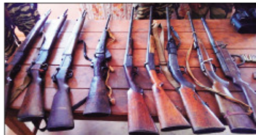
Betsaka ny fitaovam-piadiana fampiasan'ny dahalo no efa sarona any Brieville.

Manomboka miverina tsikelikely amin'ny laoniny amin'izao fotoana izao ny fandriampahalemana any amin'ny manodidina an'i Brieville ao anatin'ny distrikan'i Tsaratanàna faritra Betsiboka iny, sady tafalatsaka ao anatin'ny ilany atsimo andrefan'Amparafaravola. Izany no tanteraka dia teo ny ezaka lehibe eo amin'ny fampandriana fahalemana aton'ny miaramila avy ao amin'ny R.M.3 Toamasina sy ny R.M.4 Mahajanga ary ny zandari-mariam-pirenena avy aly Alaotra Mangoro. Velombolo araka izany ny mponina any an-toerana noho izao fiverenan'ny fandriampahalemana any amin'izy ireo izao ary nangataka ny mba hanohizana hatrany izany izy ireo, mba hahafahana mamerina amin'ny laoniny ny seha-pihariana izay potika tanteraka noho ny hetroketraky ny dahalo sy ny jiolahy, izay tena nahazo vahana tokoa. Na izany