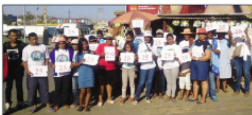
Ny sasany amin'ireo mpitarika ny antoko TIM ao Anosizato Andrefana.

Nanamafy ny fototra tamin'ny fokontany miisa 2 ao amin'ny Kaominina Anosizato Andrefana, ny avy amin'ny antoko Tiako i Madagasikara (TIM) ao amin'ny Kaominina Antananarivo Atsimondrano. Tontosa ny sabotsy teto tokoa tao amin'ny Kaominina Anosizato Andrefana ny ftsidihana ny fonkotanin'Antandrokomby sy Ankazotoho nataon'ny avy amin'ny antoko TIM.