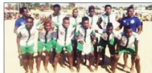
Ny Bareaan'i Madagasikara Beach Soccer.

Eo amin'ny baolina kitra lalao amin'ny torapasika na Beach Soccer dia tafita amin'ny dingan'ny famaranana aty Afrika amin'izany ny Bareaan'i Madagasikara, eo amin'ity taranjam-panatanjahantena ity. Any Egypta no hatao ny dingan'ny famaranana amin'ny CAN 2018 eo amin'ity Beach Soccer ity, ny 9 ka hatramin'ny 14 desambra 2018 ho avy izao.