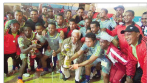
Ny boriboritany I, nahazo ny amboara avy amin'ny ben'ny tanàna sy ny CUA.

Tontosa ny faran'ny herinandro teo, tetsy amin'ny kianja Mitafon'i Mahamasina ny lalao famaranana FUTSAL, na foot à 7 izay nokarakarin'ny Kaominina Antananarivo Renivohitra (CUA). Nandrombaka ny amboara natolotry ny ben'ny tanàna Lalao Ravalomanana nandritra ny lalao famaranana tamin'ity FUTSAL ity ny ekipan'ny Boriboritany voalohany raha nampiondrika ny ekipan'ny Polisy monispaly tamin'ny isa 4 no ho 2 tamin'ny lalao famaranana. Nahazo ny laharamanana faha-3 kosa ry zareo avy amin'ny DCVC na ny foibem-pitondran'ny kolontsaina sy ny fiainam-piaraha-monina ao amin'ny CUA. Hetsika ara-panatanjahatena nentina hampialana voly ireo mpiasan'ny boriboritany enina sy ny avy ao