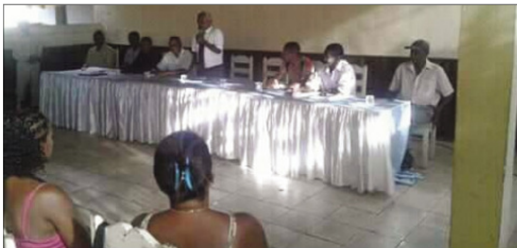
Mavitrika ihany koa ny mpanohana ny kandida laharanana faha-25, any Amparafaravola