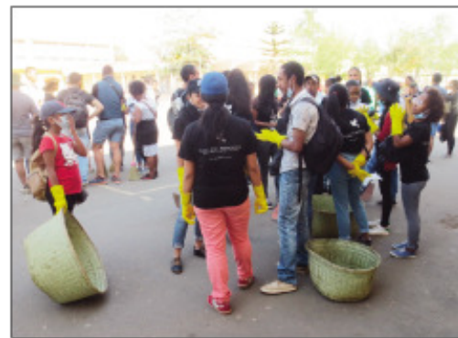
Ny sasany amin'ireo nanao fanadiovana nandritra ny andro maneran-tanin'ny fanadiovana ny sabotsy teo.

Ny Sabotsy 15 Septambra 2018 dia nankalaza ny andro maneran-tany ho an'ny Fanadiovana koa ny Kaominina Antananarivo Renivohitra (CUA), tamin'ny alalan'ny fikarakarana hetsika manokana tamin'ny fanadiovana ny tanàna, izay nanomboka teny Ampefiloha, Anosy, Ambohidahy sy teny amin'ny faritry ny lalamby Anosibe. Nahatsapa ny maha zava-dehibe ny fanadiovana ny tanàna ireo avy eo anivon'ny Boriboritra Voalohany, ka izay no nahatonga azy ireo nanetsika ireo rantsamangaika teny anivon'ireo Fokontany 44 izay mandrafitra iity Boriboritra Voalohany ity. Amin'ny maha andro maneran-tany ho an'ny fanadiovana azy dia teo ihany koa ny fampianin'ireo orinasa lehibe toy ny STAR, Eau Vive ary ny « JICA Groupe » sy ny « Jeune Chambre International »... Efa ani-