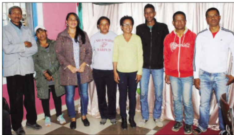
Ireo mpitarika ny KMMR Ivato.