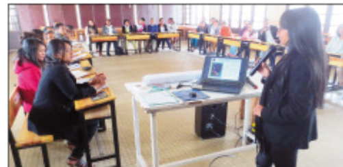
Ny fanofanana nomen'ny ONN tetsy amin'ny BMH Isotry.

Nomen-dry zareo avy ao amin'ny ONN (Office National de Nutrition) fampiofanana momban'ny fanjarian-tsakafo ireo mpiasa avy ao amin'ny Departemanta misahana ny asa sosialy sy ireo « agents sociaux » izay mpiantsehatra eny anivon'ny vahoaka ifotony manerana ny Boriboritany enina amin'ny Kaominina Antananarivo Renivohitra (CUA), ny herinandro teo, teny amin'ny BMH Isotry. Maro ny fampianarana izay azon'ireo mpiasan'ny Kaominina Antananarivo Renivohitra nandritra izany fiofanana izany toy ny : fomba fitantanana, fikarakarana, fanajariana sy ny fomba fihinanana sakafo ara-pahasalamana tsy mila handaniana vola be. Araka ny namberan'ny Talen'ny Departema-