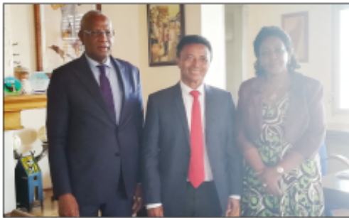
Ny iraky ny ONU, nihaona tamin'ny filoha Marc Ravalomanana teny Faravohitra.

Nihaona tamin'ny kandidà laharana faha-25, Marc Ravalomanana, teny amin'ny trano fonenany teny Faravohitra, ny iraka manokan'ny Sekretera Jeneralin'ny Firenena Mikambana (ONU), ny mpanolotsaina manokany Abdoulaye Bathily, afak'omaly. Tamin'izany no nampahafantarany an'ity iraka avy any New-York ity ireo olana misy eto amintsika amin'izao iatrehana fifidianana filohampirenena izao. Nandritra ny fihaonana dia nankasitraka ny fianakavianambe iraisam-pirenena, manokana amin'izany ny ONU, ny Filoha Marc Ravalomanana amin'ny fahalinan'izy ireo momba ny fifidianana filohampirenena