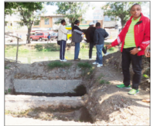
Ny fanadiovana tatatra nataon'ny Boriboritany I.