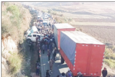
Loza mahatsiravina nitranga tany Ambatolampy.

Nisehoana lozam-pifamoivoizana miisa 2 tamin'ny lalam-pirenena faha-7 iny, tany amin'ny distrikan'Ambatolampy omaly. Ny voalohany dia fiara Sprinter mpitatitra zotra nasionaly iray nisongona fiara 4x4 no nidona tamin'ny kamiao. Ny lozam-pifamoivoizana faharoa indray dia fiara lehibe mpitatitra entana iray no nivarina tany an-kady. Vokat'ireo lozam-pifamoivoizana miisa 2 ireo: olona 2 no namoy ny ainy, 31 naratra mafy. Ireo naratra dia