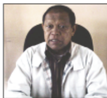
Ny ben'ny tanànan' Ambatondrazaka.