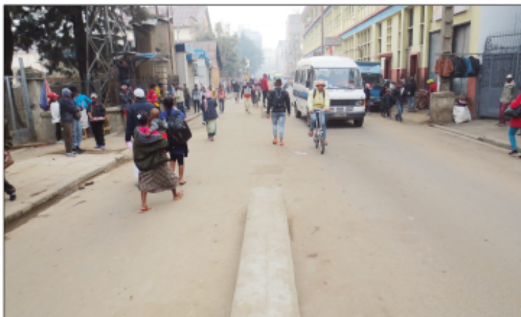
Ny fanatsarana ny lalana etsy amin'ny Petite Vitesse.

Nosokafan'ny Kaominina Antananarivo Renivohitra (CUA), ny Lalana Rainibetsimisarakana manolana ny Petite Vitesse, nanomboka ny talata 11 Septambra 2018, rehefa nihidy tsy afaka nampiasain'ny fiarakodia nandritra ny efa-bolana. Noraisin'ny Kaominina izao fanapahan-kevitra izao mba ho fisorohana ny fitohanana ny fifamoivoizana izay tena isan'ny mampikaikaika ny olona tokoa ankehitriny. Vao mangiran-dratsy araka izany dia tonga niarantana tamin'ny fanadiovana sy ny fanesorana ireo mpivarotra amoron-dalana izay tena hita fa manelingelina ny fifamoivoizana ireo ekipan'ny Boriboritany Voalohany, ireo mpiandraikitra ny tsena ary ny Polisi Monispaly. Araka ny nambaran'ny tompon'andraikitra avy eo an-