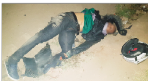
Maty tsy tsa-drano ilay mpitondra moto.