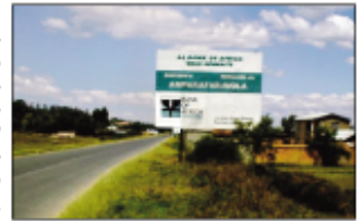
Ambohiphaonan'ny mpandraharaha ny teto Amparafaravola.

Notontosaina tao amin'ny renivohitra ny distrikan'Amparafaravola ny zoma lasa teo ny andiany faharoa mahakasika indrindra ny sehatry ny fifampisamboram-bola, izay hifanaovan'ny mpanjifa sy ny mpampisambotra toy ny banky sy ny banky madinika. Isan'ny niompanan'ny ady hevitra ny mahakasika ny tsy mety mahatafoaka ny mpanjifa amin'izany ireny. Nahallana ny rehetra ity ady hevitra narahina dinik'asa ity. Niompanan'ny fanontanian'ny rehetra tamin'izany ny hoe maninona no tsy mivoaka amin'ny fotoana izay ilàna azy ny vola angatahin'ny mpanjifa ka zary lasa mahatafidi-kizo azy ireo, teo ihany koa ny mahakasika ny zanabola sy ny famerenana azy io ary indraindray ny olana goavana mianjady amin'ny tantsaha rehea tratrin'ny loza voajanahary ny fambolena izay ataony ka tsy ahafahany mamerina izany amin'ny fotoana izay nifanomezana. Nahitam-bainy avokoa ireny rehetra ireny. Hita tonga tao ireo tompon'andrika ity sy ny solontenan'ireo banky misy aty Alaotra amin'izao fotoana izao ary hita tao ihany koa ny tompon'andrika-panjakana nahitana ny Loholon'ny Madagasikara izay agady nananana sy vy nahitana izao diniky ny mpianakavy izao nanomboka tamin'ny andiany voalohany ka izao nitohy amin'ny andiany faharoa izao. Teo ihany koa ny avy any amin'ny ministera ary ny Lehiben'ny distrikan'Amparafaravola sy ny Ben'ny tanàna ao an-toerana.