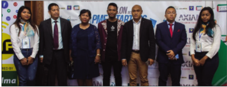
Ny ministra Guy Rivo sy ny sasany amin'ireo mpikarakara ny salon des PME et Startups.