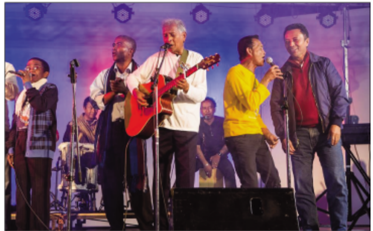
Ny famaranana ny taom-pianarana 2017-2018 tao amin'ny Lycée privée Les Rossignols Ambohimarina ny sabotsy teo.