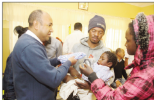
Ny didimpoitra maimaimpoana faobe tetsy amin'ny Boriboritany faha-3.