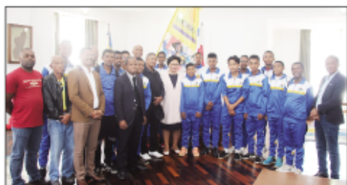
Ny fihonana ny Ben'ny Tanàna tamin'ny AJESAIA-U16 tetsy Analakely.

Handray anjara amin'ny fifaninana iraisam-pirenena eo amin'ny baolina kitra antsoina hoe Gothia Cup China, hatao any Chine ny ekipan'ny Ajesaia- U16 ny 7 ka hatramin'ny 21 aogositra ho avy izao. Tonga nangataka tso-drano tamin'ny ben'ny tanànan'Antananarivo Lalao Ravalomanana izy ireo omaly maraina, tetsy amin'ny Lapan'ny tanànan'Analakely. Tamin'izany no nanomezany ben'ny tanànan'Antananarivo Lalao Ravalomanana tso-drano ho azy ireo ha-