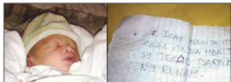
Ilay zaza menavava nisy nanary sy ny taratasy nataon'ny reniny.