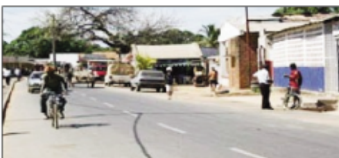
Ny tanànan'Antsohivy, renivohitry ny faritra Sofia.

Fampirantiana voakatra mampalaza ny faritra Sofia no navoitra nandritra ny fanokafana tamin'ny fomba ofisialy ny foaran'ny vehivavy Afrikana tany amin'ny faritra iny omany, izay notanterahina tao an-drenivohitry ny faritra Sofia, tany Antsohivy. Anisan'ny kendrena amin'izany dia ny mba hahafahan'ireo vehivavy samy vehivavy mifanohana eo amin'ny fanaovana asa tanana sy manatsara ny tokantrano. Mandray anjara amin'izao hetsika