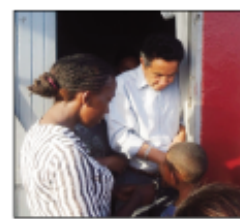
Ralipo avy amin'ny Dis-TIM Boriborintany I.

trany ity mpanao pôlitika ity raha te-hirosa amin'ny fifidianana isika satria Ravalo tsy mila disadisa sy korontana, fa fifankatiavana sy fahendrena no taritra amin'ity fifidianana filoham-pirenena ity. Anio dia fotoam-be indray etsy Behoririka ary miandry toronika ny vahoaka mpitolona amin'izao fametrahana dosie firosahan-ko fidiana izao eto amin-tsika.