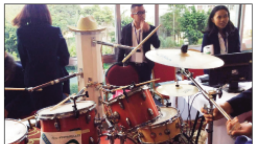
Anisan'ny zava-bitan'ny mpianatra ny ISPM naseho tetsy amin'ny Hotel Carlton Ampefiloha.

Nifanaretsaka tamin'ny habetsahan'ny mpitsidika ny teny amin'ny Hotel Carlton Anosy tao anatin'ny roa andro, ny Talata 31 Jolay sy ny Alarobia 01 Aogositra. Nahasrika olona maro ny velatseho(Salon) nokarakarain'ny Institut Supérieur Polytechnique de Madagascar - ISPM - eny Ambatomaro Antsobolo, izay nampirantiana ireo voka-pikarohana vitany amin'ny mpianatra ao amin'ny tamin'ireo tranoeva niasa hatrany amin'ny 200 mahery. Nahavariana sy nahaliana ireo vokatry na teo amin'ny lafiny mekanika, elektromekanika, ny informatika, fikarohana sakafo isan-karazany solombary na solon-kena, ny voankazo azo nahodina ho karazan-tsakafo maro