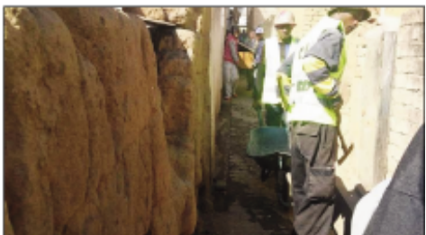
Ny fanadiovana faobe teny amin'ny Boriborintany faha-VI.