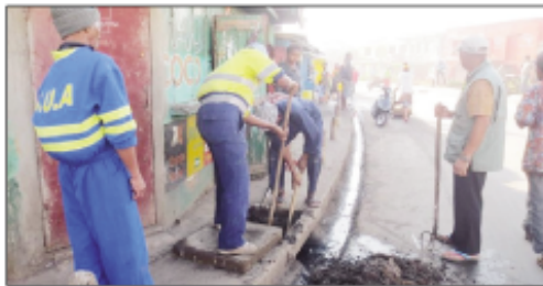
Fanadiovana teny Andohatopenaka.

B eazina hatrany ireo vahoaka izay mipetraka sy mpilav'ahitra eto an-dRenivohitra mba hahalala hitandro ny fahadiovan'ny tanàna, rehefa tsy mandoto mantsy dia efa anisan'ny manadio hoy ny nambaran'ireo tompon'andraikitra avy eny anivon'ny Boriboritany Voalohany nandritra ny fanadiovana faobe izay fanaon'izy ireo isaky ny Talata. Raha ny teny Andohatopenaka I dia hita