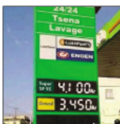
Nahitana fiakarany indray ny vidin-tsolika.

N isondrotra indray ny vidin-tsolika omaly teny amin'ireo toby fitsinjara solika eto amintsika. Arak'izany dia tratran'ny fisandratana indray ity loharanon'angovo iray eto amintsika ity. Araka ny hita teny amin'ireo toby mpitsinjara solika nanomboka omaly io, nisonga 50 Ar isaky ny litatra ny gazoala sy ny lasantsy. Arak'izany, tsy mahazo lasantsy 1 litatra intsony ny 4000 Ar eto amintsika