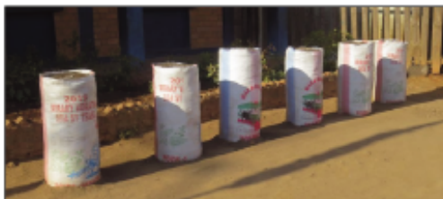
Fambolena an-drenivohitra: voly atao amin'ny gony.

Ankoatra ny fanadiovana faobe teny Andohatopenaka I dia nijery ny tetikasan'ny Boriboritany Voalohany Kaominina Antananarivo Renivohitra (CUA) mahakasika ny fambolena an-drenivohitra ihany koa ireo tompon'andraikitra avy eny anivon'ity Boriboritany I. Nanambara ireo tompon'andraikitra fa ity tetikasa fambolena an-drenivohitra ity dia hatao manerana ireo EPP 20 izay ao anatin'ny Boriboritany Voalohany. Taoriana ny fambolena teny anivon'ny EPP 67Ha Avaratra Atsinana, ny