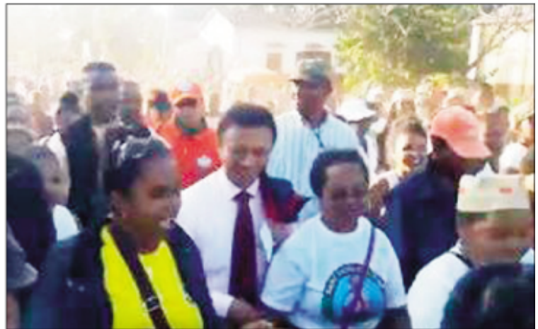
Ny tafa tamin'ny mpanao gazety momban'ny amboaran'ny Ben'ny Tanàna eo amin'ny rugby.