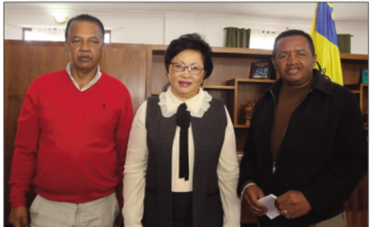
Ny Ben'ny Tanànan'Antananarivo nitso-drano ireo avy amin'ny FC Academica hisolo tena an'i Madagasikara atsy amin'ny nosy Maorisy.