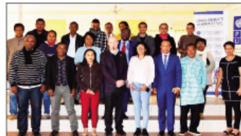
Ireo mpanao gazety tonian-dahatsoratra niofana tany Ampefy.