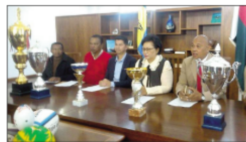
Ireo amboara lehibe hatolotry ny CUA ho an'ny mpandresy amin'ny fiadiana ny "Amboaran'ny Ben'ny Tanàna".

Fampiraisana ireo mpilalao rugby, fampiroboroboana hatrany ny taranjam-panatanjahantena baolina lavalava, ireo no anisan'ny tanjona amin'ny hanaovan'ny Kaominina Antananarivo Renivohitra (CUA) fifaninanana fiadiana ny "Amboaran'ny Ben'ny Tanàna" na "Coupe du Maire" ny 12, ny 19 ary ny 26 aogositra ho avy izao, etsy amin'ny kianjaban'i Mahamasina. Nampahafantatra izany fifaninanana izany tamin'ny mpanao gazety ny tompon'andraikitra ao amin'ny Kaominina Antananarivo Renivohitra afak'omaly maraina tetsy amin'ny Lapan'ny Tanànan Analakely, notarihan'ny ben'ny tanàna Lalao Ravalomanana sy ireo mpiara-miasa aminy akaiky. Ireo ekipa sangany ao amin'ny Federasiona sy ny ligin'Analamanga no handray anjara amin'izao fifaninanana izao, hisy ihany koa ny tarika vehivavy mpilalao rugby handray anjara amin'izany. Ny amboara fifaninanana dia tena ho lasan'ny mpandresy amin'ny famaranana, hisy ihany koa anefa ny