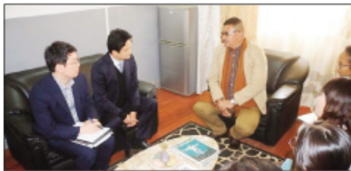
Ny lehiben'ny faritra Vakinankaratra nandray ny masoivohon'i Korea Atsimo.

hahafantarany izay tokony hanampiana ny Faritra Vakinankaratra. Taorian'izay dia nandeha nidina ifotony ireo delegasiona ireo nijery ny mandidina ny fanabezana ny ankizy aty Madagasikara ireo délégasiona ka ny EPP Tomboarivo no notsidihina tamin'izany. Ny ahafantarana tantolo iainan'ny ny fanabeazana fototra sy ny olana mianjady amin'izy ireo no nambara ho anton'ny