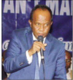
Ny filohan'ny antoko HVM teo aloha Rivo Rakotovo.

Nanao fanambarana tetsy amin'ny Hotel Carlton Ampefiloha omaly ny Filoha nasionalin'ny antoko Hery Vaovao'i Madagasikara na HVM, Rivo Rakotovo. Nola-zainy tamin'izany fa metra-pialana amin'ny fitarihana ity antokon'ny fitondrana ity ny tenany, araka ny fanazavany dia fandaminana anatin'ny antoko HVM vaovao tsy ho anton'izany, mijanona ho mpikambana tsotra ao anatin'ny antoko ihany ny Filohan'ny Antenimierandoholona araka ny nambarany ary tsy manam-pahavalo na iza na iza ao anatin'ny antoko