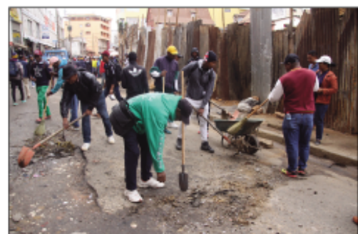
Ny fandaminana sy ny fanamboarana teny Tsiatzotazo nataon'ny Boriboritany faha-3.