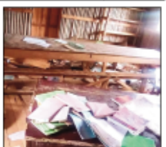
Ny fahapotehana tamin'ny sekoly tao Marolambo.