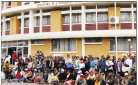
Ny hetsiky ny mpanabe tetsy amin'ny Tranoboribory Anosy omaly.