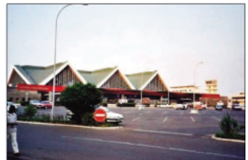
Tsy tafavoaka an'ivato ilay vazaha.