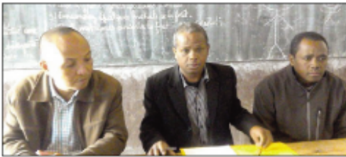
Ireo nanao valan-dresaka ho an'ny mpanao gazety teny Analamahitsy.