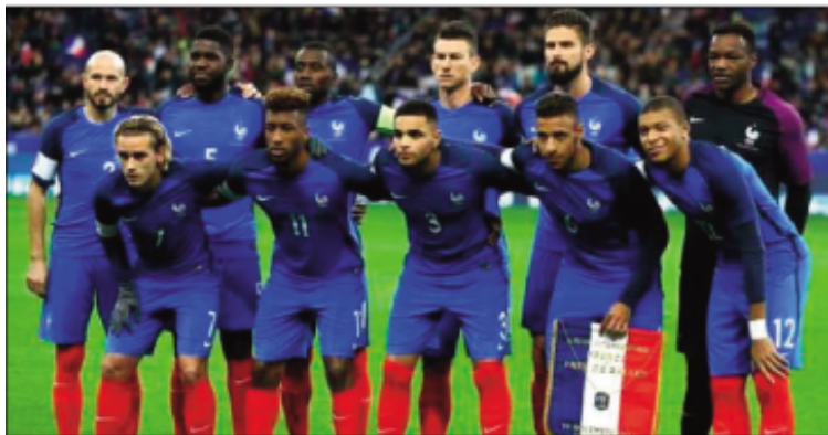
Ny ekipam-pirenen'i Frantsa.

ny toetsain'ny Frantsay izay mbola misy tandin-don'ny fanjanahana satria ny ankamaroan'ny mpilalao ao anatin'ny ekipam-pireneny dia mainty hoditra, fa ny mpanazatra kosa dia tsy maintsy vazaha Frantsay. Ny dikan'izany dia tsotra, ampiasaina ham-