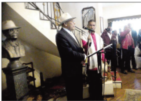
Kandida ho Filohampirenena iray hafa koa ny Praministra teo aloha Jean Omer Beriziky.

Fantatra ny faran'ny herinandro teo, tetsy amin'ny Villa La Franchise tranon'ny filoha teo aloha Profesora Zafy Albert fa ho kandida filohampirenena ny Praministra teo aloha Jean Omer Beriziky. Ny fikambanana Soa lombonana no manolotra azy ho kandida amin'izany fifidianana Filohampirenena ny 7 novambra ho avy izao izany. Ny fikambanana Soa lombonana dia ahitana ny avy amin'ny antoko UNDD sy ireo antoko politika sy fikambanana maro samy hafa manohana ity Praministra teo aloha ity. Ahitana solontena avy amin'ny