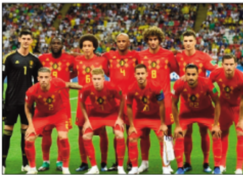
Ny ekipam-pirenen'i Belgique.

lina kitra amin'ny sehatra iraisam-pirenena satria samy mihezaka ny rehetra. Efa tonga amin'ny dingan'ny 1/2-dalana ny lalao anio, satria anio hariva no hanomboka ny manasa-dalana voalohany hihaonan'i Frantsa sy Belgique; hitohy rahampitso alarobia izany amin'ny lalao ankatoky ny famaranana faha-2 eo amin'ny fahaonan'i Angletera sy Croatie. Fihonana izany samy hiady dia hiady tokoa na ny anio na ny rahampitso. Efa azo antoka izany fa tsy maintsy ny iray amin'ireo ekipam-pirenena 4 ireo no handrobaka ny amboaran'ny tompo-daka eran-tany amin'ny baolina kitra 2018, na i Frantsa, na i Belgique, na i Angletera na i Croatie. Fa ankoatra izay dia tsikantra ihany