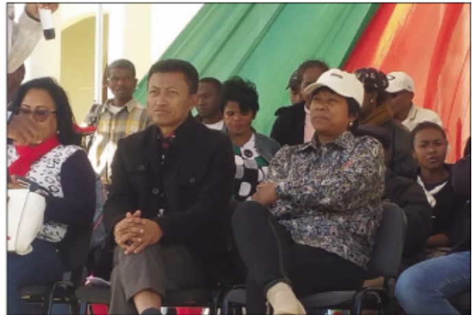
Ny fitokonana teo amin'ny minisiteran'ny Fanabeazam-pirenena omany.