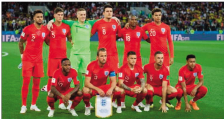
Ny ekipam-pirenen'i Angletera.

lina kitra amin'ny sehatra iraisam-pirenena satria samy mihezaka ny rehetra. Efa tonga amin'ny dingan'ny 1/2-dalana ny lalao anio, satria anio hariva no hanomboka ny manasa-dalana voalohany hihaonan'i Frantsa sy Belgique; hitohy rahampitso alarobia izany amin'ny lalao ankatoky ny famaranana faha-2 eo amin'ny fahaonan'i Angletera sy Croatie. Fihonana izany samy hiady dia hiady tokoa na ny anio na ny rahampitso. Efa azo antoka izany fa tsy maintsy ny iray amin'ireo ekipam-pirenena 4 ireo no handrobaka ny amboaran'ny tompo-daka eran-tany amin'ny baolina kitra 2018, na i Frantsa, na i Belgique, na i Angletera na i Croatie. Fa ankoatra izay dia tsikantra ihany