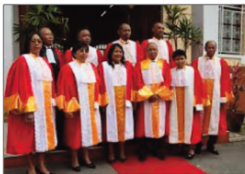
Ireo mpikambana ao amin'ny HCC ankehitriny.

Momba ny raharaham-pirenena amin'izao fotoana dia hitan'ny mpanara-baovao fa tsy masin-teny sy tsy mahavita ny adidiny ny HCC na ny Fitarana Avo momba ny Lalampirenena. Ny anton'izany dia ireo parlematera senatera sy depiote-n'i Madagasikara tsy nahavita fanambaran-pananana dia tsy misy naongana. Ny depiote mpivadibadika palitao na tsy nanaja ny mandat impé- ratif dia tsy misy voasazy. Ny antsoina hoe pacte de responsabilité izay navoakany tamin'ny fanonganana voalohany ny filoha Hery Rajaonarimampianina dia tsy