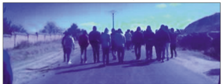
Rakotra setroka lakrymôzena ny teny amin'ny CUR Vontovorona.