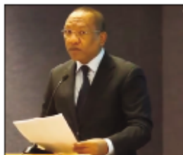
Ny Praministra Ntsay Christian.

Nanao fanambaram-pananana tetsy amin'ny Fitarana Avo momba ny Lalampirenena (HCC) omaly tolakandro, tetsy Ambohidahy, ny Praministra Ntsay Christian. Heverina fa hanao toa azy koa ireo mpikambana vaovao ao amin'ny governemanta ato ho ato. Ny fanambaram-pananana dia tsy maintsy sy tokony hataon'ny mpiasam-panjakana ambony manana andraikitra rehetra, izany dia ao anatin'ny ady amin'ny kolikoly eto amin'izany. Hatramin'izao anefa, mbola misy tompon'andraiki-panjakana sy olom-boafidy, mbola tsy nanatanteraka izay fanambaram-pananana izay, tsy mbola misy anefa hatreto ny sazy mahazo azy ireo, nefa mahavoa-sazy izay tsy fanaovana fanambaram-pananana izany. Tsy misy olona ambany na ambonin'ny lalàna, noho izany tokony hampiharina ny lalàna sy ny sazy ho an'ireo mbola tsy nanao fanambaram-pananana ireo.