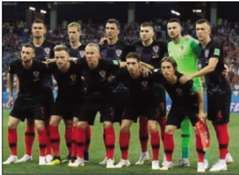
Ny ekipam-pirenen'i Croatie.

S amy maminavina ny rehetra ny amin' izay handrobaka ny amboara erantany amin'ny baolina kitra. Hatramin'izao aloha dia saika diso daholo ny vinvina nataon'ny ankamaroan'ny maro satria tsy nisy nanampo ny fodian'i Allemagne, Espagne, Portugal, Argentine, Brésil. Fa na inona na inona resahana dia tsy misy intsony amin' izao fotoana izao ny ekipa ambany na ekipa ambony eo amin'ny bao-