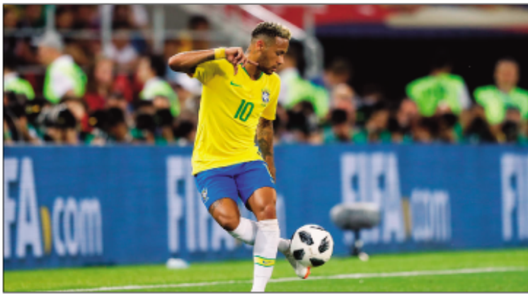
Cavani- Uruguay, Griezmann- Frantsa, Neymar- Brezila, anisan'ny harahan'ny maro maso akaiky amin'izao 1/4-dalan'ny Mondial 2018 izao.

dalana izao. Ny fiandohan'ny herinandro ho avy io kosa no hatao ireo lalao 1/2-dalana roa ary ny alahady 15 jolay ny lalao famaranana amin'ny Mondial 2018 ity.