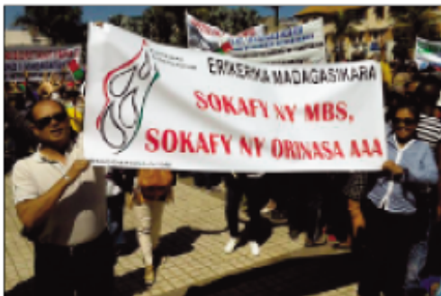
Ny Erikerika Madagasikara nitaky ny fanokafana ny MBS sy ny AAA-Tiko.

Ny fikambanana Erikerika Madagasikara any Frantsa dia fikambanana manohana ny toloana ataon'ny mpomba ny filoha Marc Ravalomanana na dia any ampitandranomasina aza. Isan'ny nitaky ny hisokafan'ny MBS sy AAA-Tiko ny fikambanana Erikerika Madagasikara. Ankoatra izay, misy ny asa sosialy ataon'izy ireo any amin'ny sekoly fanabeazana fototra EPP, toy ny fizarana sakafo sy fanomezana ho an'ireo ankizy sahirana any amin'ny faritra Atsimondrano iny . Teo ihany koa ny fanampiana ny gazety Ny Valosoa vaovao tamin'ny