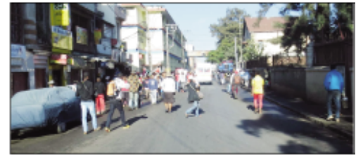
Ny lalana etsy amin'ny Petite Vitesse Soarano.