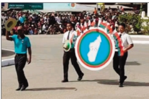
Nandray anjara tamin'ny fankalazana ny fetim-pirenena ny tanoran' Mahajanga.

20 andro teo no natao- kan'ny Prefektoria sy ny Faritra Boeny ary ny Kaomina an-drenivoitri Mahajanga, niaraka tamin'ny Komity mpano- mana, nankalazana ny Fetim-pirenena 26 Jona 2018 tany Mahajanga. Diaben'ny fahafahana narahina Zumba no nanokafana izany nanom- boka ny Zoma 08 Jona. Nandraisan'ireo mpiasa miankina na tsia, mpia- natra sy fikambanana anjara, notarihin'ny Pré- fetsy ny Lehiben'ny fari- tra ary ny Ben'ny Tanà- nan' i Mahajanga. Tao anatin'izay 20 andro izay ihany koa dia nisy ireo fi- faninanana ara-panatan- jahan-tena, kermesin'ny Foloalindahy, ny vavaka iraisam-pinoana kristia- na ankilany ary silamo andaniny. Ny 25 jona maraina dia nisy fizarana mari-boninahitra ho an' ireo mpiasa isan-tsoka-