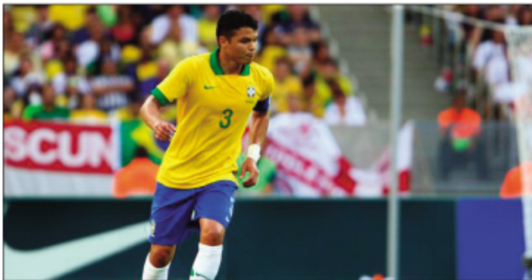
Thiago Silva, kintana Brezilianana, ankoatra an'i Neymar.