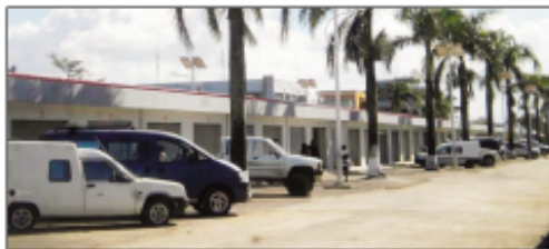
Ny Bloc Commercial vaovao any Toamasina.