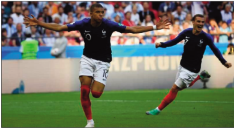
Mbappe sy Griezmann, anisan'ny kintan'ny baolina kitra Frantsay amin'izao.