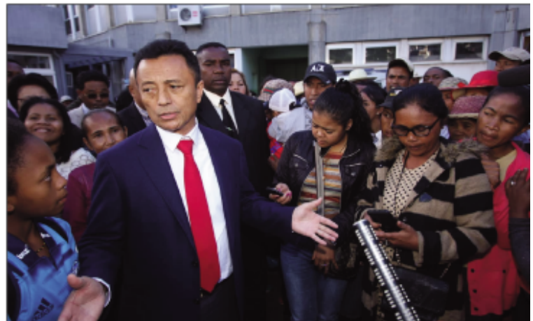
Maro hatrany ireo vahoaka miatrika ny tolonga etsy amin'ny kianjan'ny 13 mey Analakely.