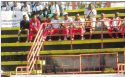
Ny fanokafana ny lalao ara-panatanjahantenan'ny ASIEF tany Toamasina.

Tontosa ny sabotsy maraina teo tao amin'ny Piscine Olympique CRJS Toamasina ny fanokafana ofisialy ny lalao ara-panatanjahantena eo anivon'ny mpiasampanjakana, izay fanatanjahantena fitaizambafana, tafiditra anaty program'ny ASIEF na ny Association Sportive Inter-Ministerielle pour l'Entretien des Fonctionnaires. Nosantarina tamin'ny matso nataon'ireo mpanandray anjara, narahany ny fianianan'ireo mpitsara ankilany, sy ireo mpilalao andaniny, fa hanaraka tsara ny fepetra misy. Ny 07 jolay no hanomboka ny fihonana ka ny baolina kitra sy ny basket, tsipy kanetibe ary ny atletisma no hisy amin'izany, sampandraharahan-panjakana 19 no man-