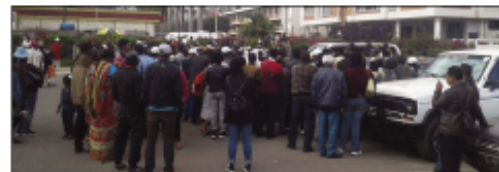
Ireo mpanabe nanohy ny tolona nanoloana ny ministeran'ny fanabeazam-pirenena tetsy Any omaly.

Mitohy ny tolona ny mpanampianatra eto Madagasikara, na nisy aza ny fihanonan'izy ireo tamin' ny Praiministra Ntsay Christian omaly, teny amin' ny Lapan'i Mahazoarivo. Ny zava-nisy teny omaly araka ny tatitry ny solontenan'ireo sendikan' ny mpanabe: nandray azy ireo ny Praiministra Ntsay Christian sy ny Ministry ny fanabeazam-pirenena Hora-ce Gatien, teny Mahazo-arivo, nanaovana ny dinika santatra. Efa tonga mialoha tao daholo ny olona be dia be tsy fantatra ny sasany ka nivoaka tamin'izany fa mba hampanjary ny dinika dia hisy solontena ho an'izay voakasika rehetra : ka ao anatin'izany ny Primatiora, ny ministeran' ny fanabeazam-pirenena,