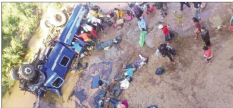
Ilay loza mahatsiravina tany Andranomena Arivonimamo.