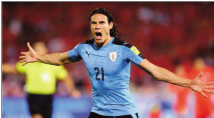
Cavani, kintana Uruguayana.