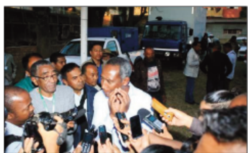
I Dama ny sabotsy teo tetsy Antanimena.

Ho kandida amin'ny fifidianana Filohampirenena-na hatao eto amin'ny 7 novambra ho avy izao koa i Dada amin'ny tarika Mahaleo, ny fikambanana politika Valimbabena no hirotsahany amin'izany. Tamin'ny alalan'ny lanonana ankalamanjana tetsy amin'ny CCECSA Antanimena no namban'ny Dama izany firot-sahany hofidiana izany. Nambarany fa nandray izao fanapahan-kevitra izao izy noho ny sonia maro izay azony, mangataka azy hirotsaka amin'izany hazakazaka ho eny la- voloha sy Ambohitsorohitra izany. Nisy ihany koa solon-