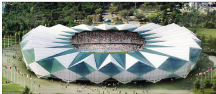
Ny kianjan'i Samara.