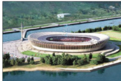
Ny kianjan'i Nijni Novograd.

zana no natao tamin'ity kianja ity ary nifarana tamin'ny Desambra 2017 ny asa. Mahazaka mpijery 44 000 ny kianjan'i Mordavia Arena ao Saransk. Tamin'ny taona 2017 no efa vonona ho an'ny Mondial ity kianja ity 45 000 ny mpijery zakan'ny kianjan'i Rostov Arena. Manamorona ny reniranon'i Don ity kianja ity. Nisy ny fanamboarana natao, izay nifarana ny 22 Desambra 2017. 35 000 ny mpijery zakan'ny kianjan'i Kaliningrad. Ny 11 Aprily 2018 no nilalovana voalohany ity