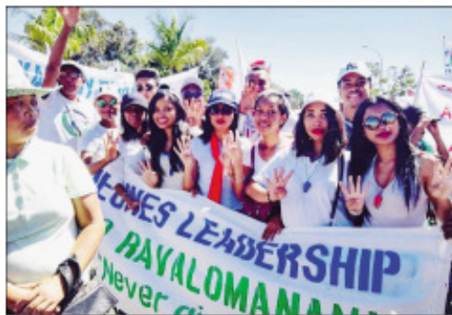
Ny sasany amin'ireo ao amin'ny fikambanana Jeunes Leaders Pro-Ravalomanana.

Mijoro amin'izao fotoana izao ny Jeunes Leaders Pro-Ravalomanana, na ny fikambanan'ireo tanora mpitarika, miara-dia amin'ny Filoha Marc Ravalomanana. Ireo tanora rehetra liana hiditra amin'izany fikambanana izany dia hasain'izy ireo, araka ny fanambarana nataony: ho avy ny fotoana hijoroana sy hisehoana amin'ny be sy ny maro, vonona ary tsy mihemotra ny Tanora manohana ny Filoha Marc Ravalomanana amin'izay adidy