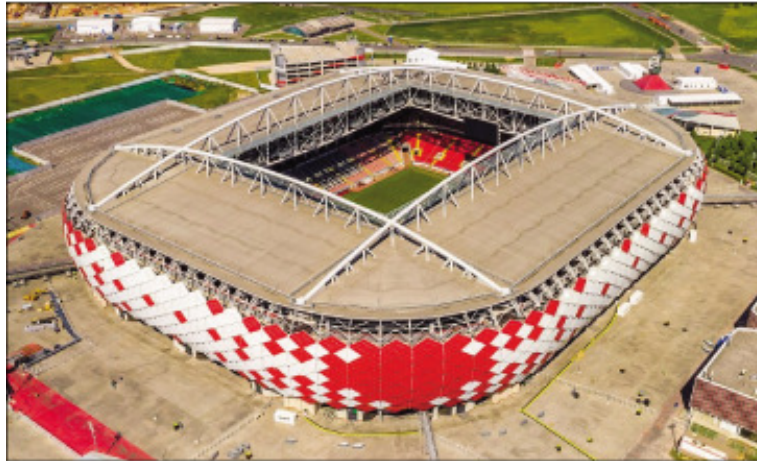
Ny kianjan'ny Spartak ao Moscou.

Ny kianjan'i Lujniki ao Moscou no hanatanterahana ny famaranana amin'izao Mondial 2018