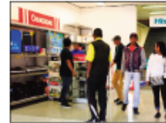
Karazan'entana hita amin'ireo Tranombaroitra Baolai.

Maro be ny fety hankalazaina eto amintsika amin'ity volana ity. Ny Alahady 17 Jona 2018 ho avy izao ohatra ny fetin'ny ray, eo ihany koa ny fetim-pirenena. Fa ny tena mahalaina ny rehetra dia ny fetibe an'ny Baolina Kitra amin'ny alalan'ny « Fifa World Cup 2018 », izay ho tontosaina any Rosia manomboka ny 14 Jona 2018 ho avy izao. Tsy disco anjara amin'izany fankalazana ny fety samihafa izany ny Tranombaroitra « Baolai ». Ho an'ny fetin'ny ray dia voa nahatonga entana maro izay lohalaharana amin'ny kalitao izy ireo, izay