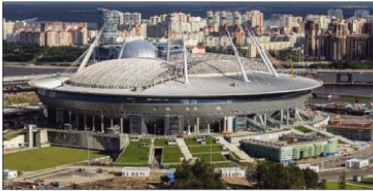
Ny kianjan'i Saint Petersburg.

12 ireo kianja handray ny Mondial andiany faha-21 any Rosia izay ampahafantarina antsika. Marihana fa midadasika ny Federasionin'i Rosia ka izay no ezahan'ny tomponandraikitra any an-toerana, natao tsy dia hifanalavitra loatra ireo kianja hilaovana. Mizara 4 ny faritra misy ireo kianja ireo raha ny saritany no jerena. Any amin'ny faritra avaratra andrefana no misy ny kianjani Kaliningrade, Saint Petersburg ; ao amin'ny faritra afovoany no misy ny kianja 2 ao Moscou, Nijni Novogograd ; any amin'ny faritra atsinanana kosa no misy ny kianjani Saransk, Kazan, Sama-