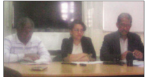
Ireo avy amin'ny SEFAMP- FFKM.