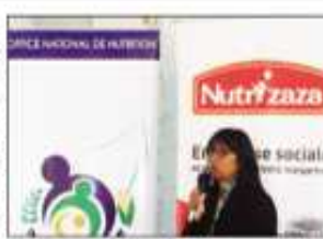
Ny tompon'andraikitra ny ONN any Vakinankaratra.

Isan'ny faritra mbola hanjakan'ny tsy fanjarian-tsakafo ny eto Vakinankaratra raha mitaha amin'ireo faritra hafa. Manoloana izany dia fantatra fa ho tontosaina ao Antsirabe indray ny hetsika « Andro Nasionaly ho an'ny Fanjarian-tsakafo ».