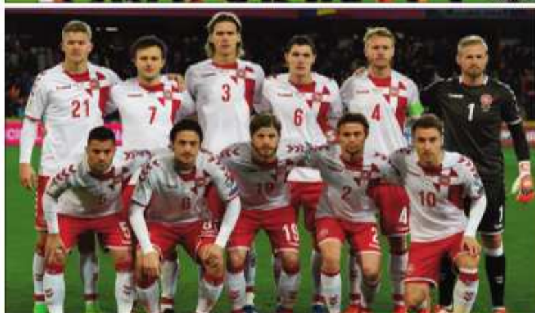
Portugal, Espagne, Danemark, anisan'ireo andrarezina eoropeana.

Colombie- Angletera. Ny 1/2-dalana dia ho tantaraha ny talata 10 jolay sy ny alarobia 11 jolay. Ny lalao famaranana kosa dia hatao ny alahady 15 jolay any Moscou.