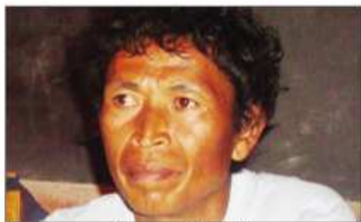
I Liva avy amin'ny KMFB.

Eo anatrehan'izao savorovoro sy korontana ataon'ny mpitondra fanjakana Malagasy ankehitriny izao hoy i Liva KMFB (Komity Miaro ny Fiainam-Bahoaka), dia maro ireo olom-pirenena malagasy no manome tsiny avy hatrany ireo mpanao politika ho tompon'andraikitra amin'izany. Ny tena marina anefa dia ny tsy fahampian'ny fahalalana no mahatonga izany. Noho izany dia anisan'ny adidin'ny mpanao politika ihany koa no mitaiza sy manome fahalalana azy ireo hoy izy, mba hahafahany misafidy sy manapa-kevitra amin'izay andraikitra tokony ho raisiny eo amin'ny toedraharaham-pireneny. Tsy misy vahoaka te-hikorontana sy hisavorovoro fotsiny izany raha ny toejava-nisy teto Madagasikara hatramin'izay sy ankehitriny manokana no resahana, fa nisy ny antony. Ho an'Andriama-