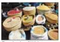
Tsy eken'ny CUA intsony ny fivarotana amin'ny tany toy izao.

Vinan'ny ben'ny tananan'Antananarivo Lalao Ravalo-manana ny fanatsarana hatrany ireo tsena misy eto an-drenivohitra. Mba hialana amin'ny gaboraka sy ny tsy ara-dalana rehetra eo anivon'ny tsenan'ny kaominina Antananarivo Renivohitra, sy ho fitandroana ny fahasalamany mpanjifa dia hisy ny fandaminana hentitra izay hape-trakin'ny Kaominina Antananarivo Renivohitra (CUA). Tapaka fa tsy maintsy mampiasa « étale » na talantalana, na latabatra ny mpivarotra tsirairay avy na ny mpivarotra isan'andro izany, na ny isan-keri-