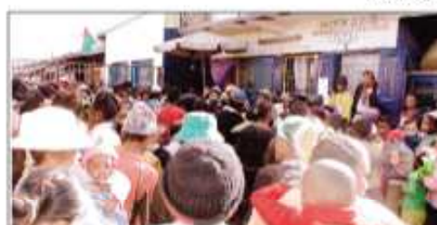
Ny hetsika nataon'ny FDTA tetsy Anosibe.