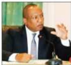
Ny Praiministra Ntsay Christian.

Nivoaka tamin'ny filan-kevity ny governemanta notarihan'ny Praiministra Ntsay Christian omaly teny amin'ny Lapampanjakan' Mahazoarivo, ny datim-pifidianana filohampirenena hatao eto amintsika amin'ity taona ity. Ny fifidianana fihodinana voalohany na ny 1er tour dia ho tanteraha ny alarobia 7 novambra 2018 ho avy izao, ny fifidianana filohampirenena fihodinana faha-2 kosa n any 2eme tour dia hatao ny alarobia 19 desambra 2018. Nambaran'ny Praiministra Ntsay Christian nandritra izany fa efa neken'